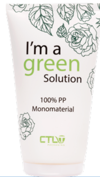
ESTube ® Primer tubo monomaterial 100% PP (cuerpo + cabeza + tapón)