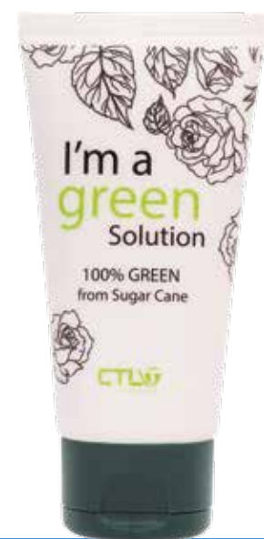
Green Tube 100% caña de azúcar