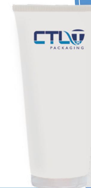
Eco Low Profile