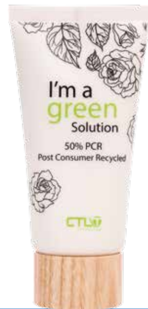
Post Consumer Recycled Hasta un 50% de la falda realizado con material virgen