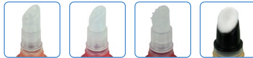
Lip Straight Lip Curved Lip Massage Sponge