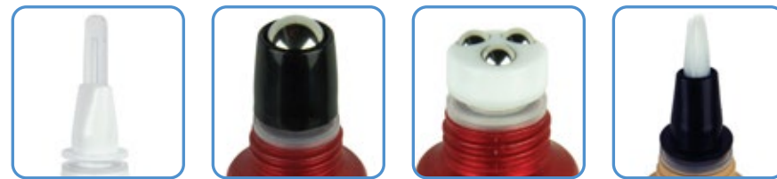
Spatula Roll on Triball Brush