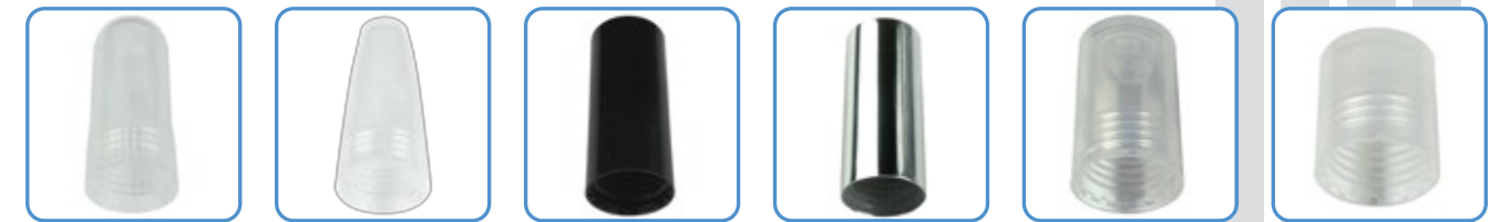
Round Conic Square Metal Roll on Triball