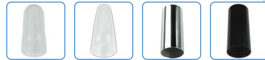
Round Conic Metal Square